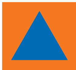
Рис.4. Голубой треугольник на оранжевом фоне