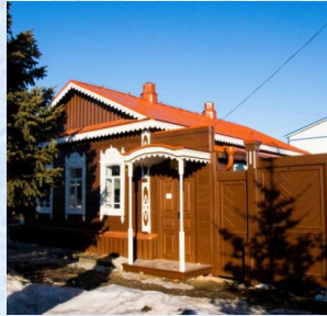
Мемориальный дом-музей В.И. Чапаева