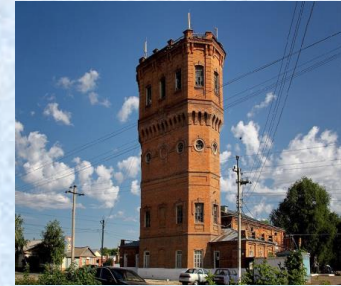
Водонапорная башня «Водосвет»