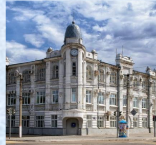
Торговый дом Шмидта