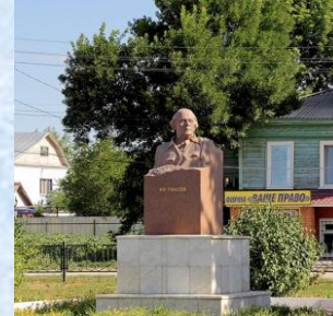
Памятник А.Н. Толстому