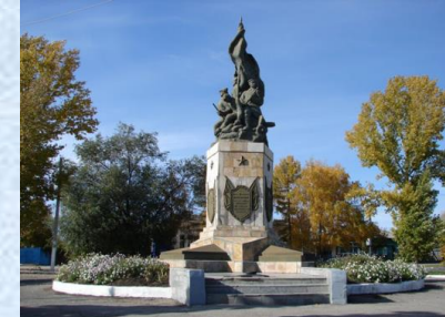
Памятник Героям Гражданской войны